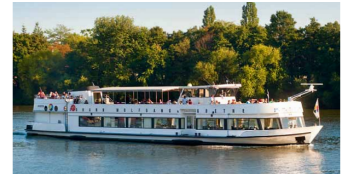
Elegant wie ein Gedicht von Goethe