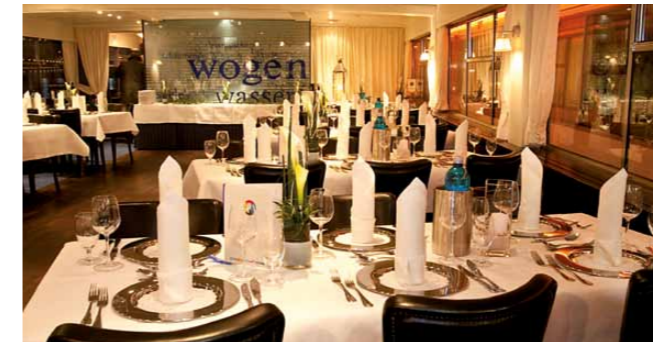
Stilvolles Ambiente für kleinere Feiern oder Tagungen

Tische und Stühle lassen sich nach Ihren Wünschen frei arrangieren. Durch die großen Panoramafenster wirkt der Innenraum hell und freundlich. Das teilweise überdachte Freideck lädt zum Sonnenbaden und Relaxen ein. Die Johann Wolfgang von Goethe – ideal für Konferenzen und exklusive Events.